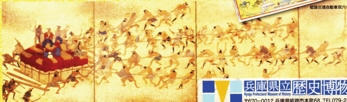
石曳図屏風(当館蔵)

兵庫県立歴史博物館 Hyogo Prefectural Museum of History