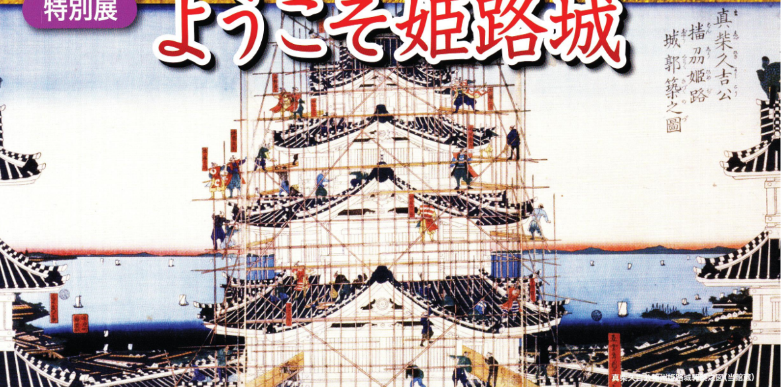
真柴久吉公「姫路城築之圖」(当館蔵)