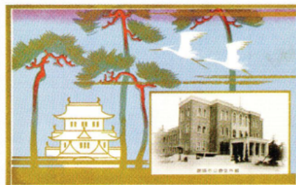
絵葉書／公会堂竣工記念