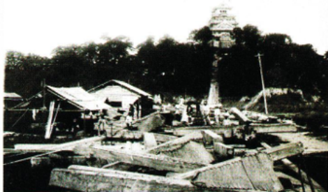
姫路城明治修理写真帖／修繕材料置場・作業場(当館蔵)