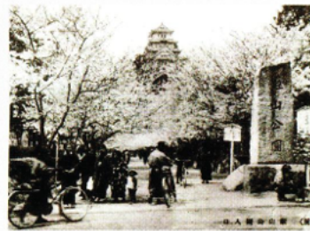
戦前の姫路／姫山公園入口