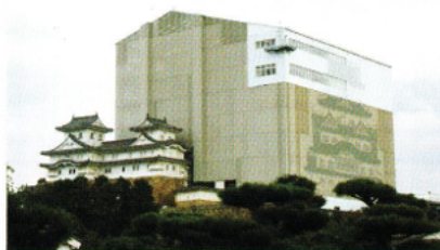
平成修理の姫路城(2011年)