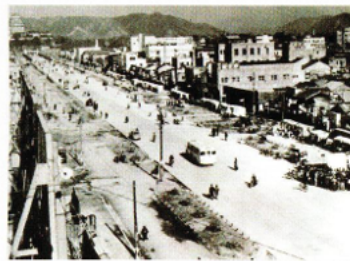
戦後の姫路／大手前通