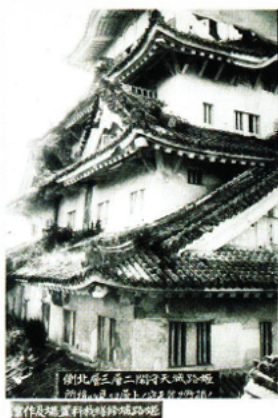
姫路城明治修理写真帖／ 乾小天守から大天守北側の 破損状況