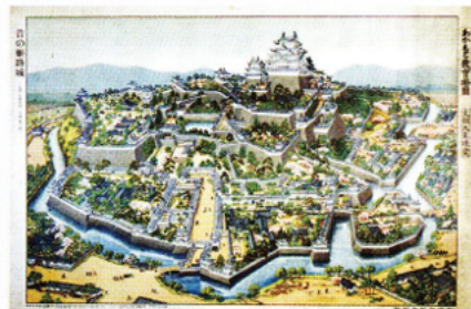
昔の姫路城／姫路城鳥瞰図(当館蔵：高橋秀吉コレクション)