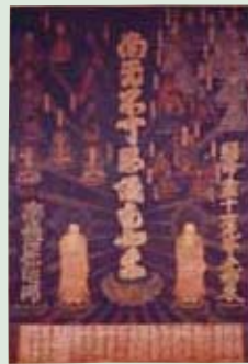
④初期真宗の本尊の「光明本尊」