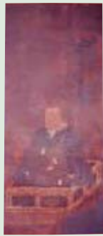
③蓮如が英賀の空善に授与した親鸞像