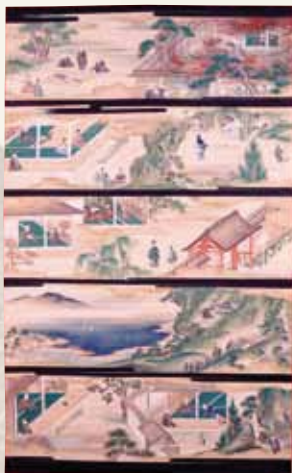
⑦蓮如の生涯を描く絵伝