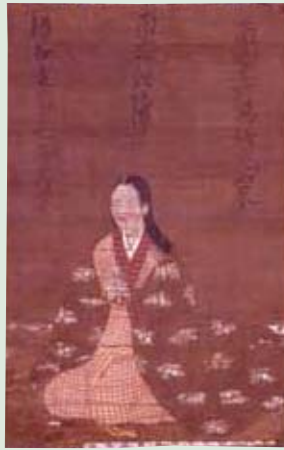
①伝親鸞の母・吉光女の像

本展では、播磨地方の浄土信仰、西国地域への浄土真宗の展開、本願寺教団の播磨進出、本願寺の東西分派による播磨への影響などについて、浄土真宗寺院に伝来した文化財を中心に明らかにし、播磨の新しい歴史像として紹介いたします。