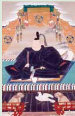
⑤本願寺の東西分派に深くかかわった徳川家康の像