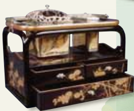
⑧将軍徳川家茂から拝領した煙草盆