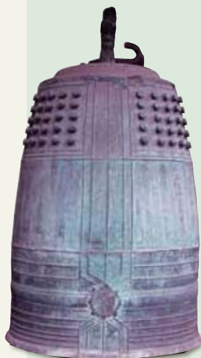
⑨英賀本徳寺の梵鐘